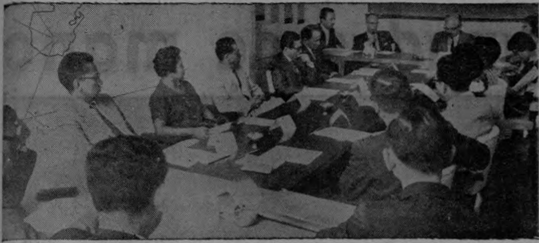
Muestra la fotografía un aspecto general del seminario en Organización y Métodos, que clausuró sus sesiones ayer en la ESAPAC. Al mismo asistieron altos funcionarios centroamericanos y asesores técnicos de las Naciones Unidas y del Punto IV

Conforme lo habíamos anunciado en edición anterior, el lunes recién pasado se iniciaron las labores de la primera parte de un Seminario de Organización y Métodos, auspiciado por la Escuela Superior de Administración Pública América Central. Al mismo concurrieron altos funcionarios del ramo de todos los países de América Central y Panamá, y asesores técnicos de las Naciones Unidas y del Punto IV. Después de cuatro días de intensa labor, clausuró hoy sus sesiones con el mejor de los éxitos. De las discusiones se obtuvieron conclusiones y recomendaciones que darán gran impulso a tan importante materia, en el campo de la administración pública centroamericana. La agenda que se siguió en las discusiones, fue la siguiente: ESAPAC Reunión preliminar sobre O & M. AGENDA Lunes 16 de marzo. Bienvenida — E. P. Laberge, Sub-Director. Los antecedentes del Seminario — E. P. Laberge, Sub-Director.